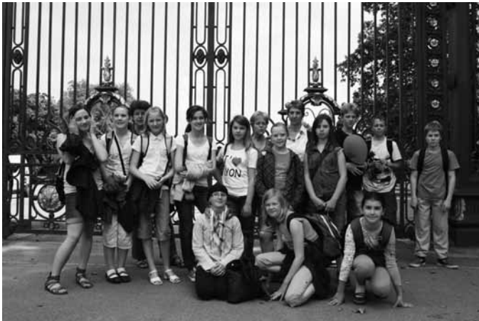
Ringsheimer Kinder vor dem Eingangstor des größten Parks von Lyon "Park de la Tête" während des Schüleraustausches bei der Partnergemeinde Albigny.

Auskunft erteilt der Freundeskreis für Gemeindepartnerschaften Ringsheim, Tel.: 07822 1606, oder per E-Mail: freundeskreis-ringsheim@online.de . Anmeldungen werden bis zum 29. Februar erbeten.